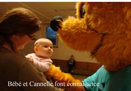
Bébé et Cannelle font connaissance

Tour d'horizon avec le Père-Noël qui a visité nos six sections. Il nous raconte: