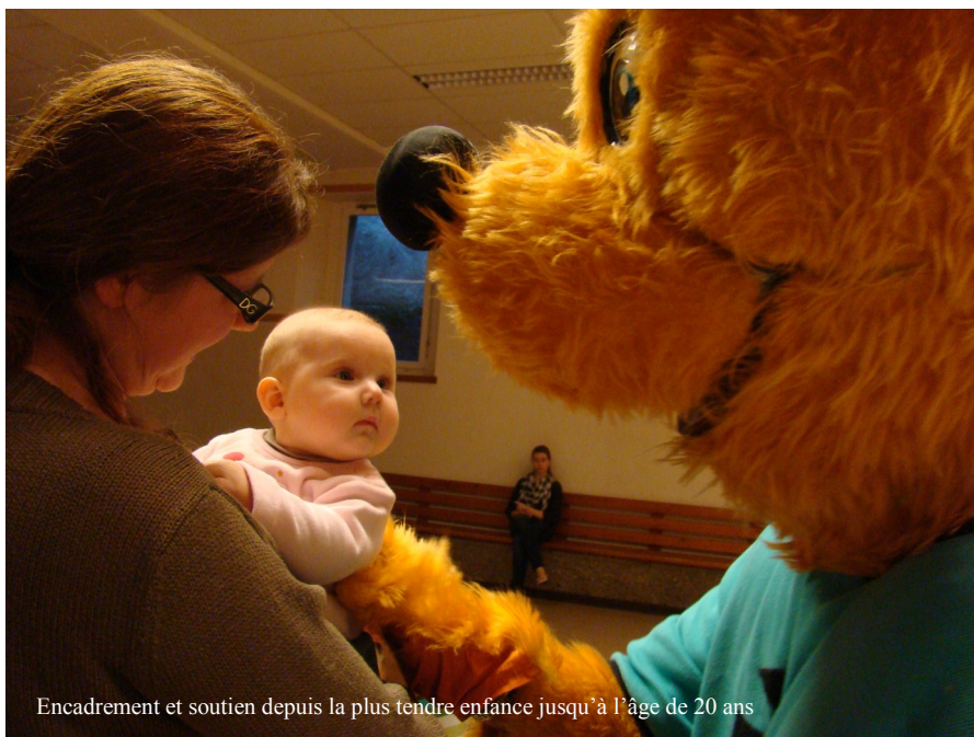
Encadrement et soutien depuis la plus tendre enfance jusqu'à l'âge de 20 ans

Depuis 1885, La Paternelle s'est engagée dans le soutien moral, financier et l'encadrement des familles de ses membres frappées par le deuil. Que de chemin parcouru et qu'en est-il aujourd'hui?