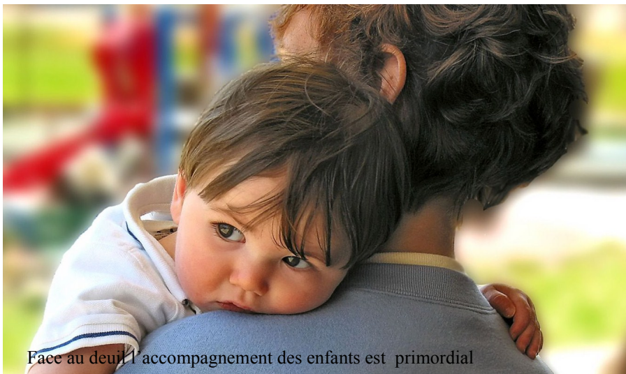
Face au deuil l'accompagnement des enfants est primordial

le besoin de s'unir face au destin tragique et le bienfondé des pionniers de La Paternelle.