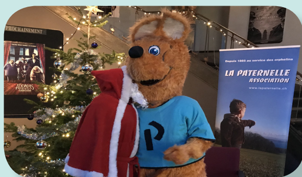
Un père Noël inconsolable

Finalement, le couperet est tombé si bien que nous avons dû nous résoudre à annuler cette manifestation pourtant tant attendue. Pour le coup, les salles obscures le sont restées et le Père Noël s'est vu contraint de subir les désagréments d'un confinement au milieu de ses lutins, en compagnie d'une Mère Noël excédée par son inaction. Exeunt le port du masque, les places libres entre les spectateurs, les désinfectants, les sens de déplacement ! Les règles sanitaires que nous avons prévues n'auront pas suffi à maintenir ouvertes les portes du cinéma pour nos retrouvailles de fin d'année.